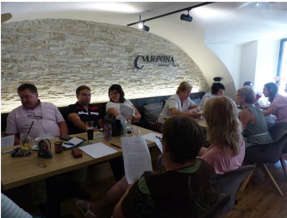
Workshop so zamestnávateľmi, Krupina