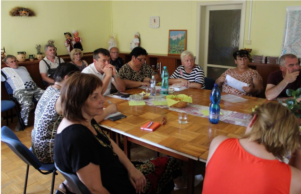
Regionálny workshop, Hrachovo