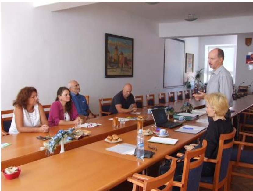
Personálne audity cieľovej skupiny